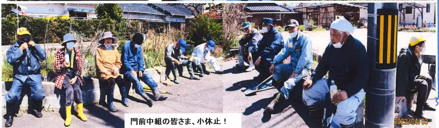
門前中組の皆さま、小休止!