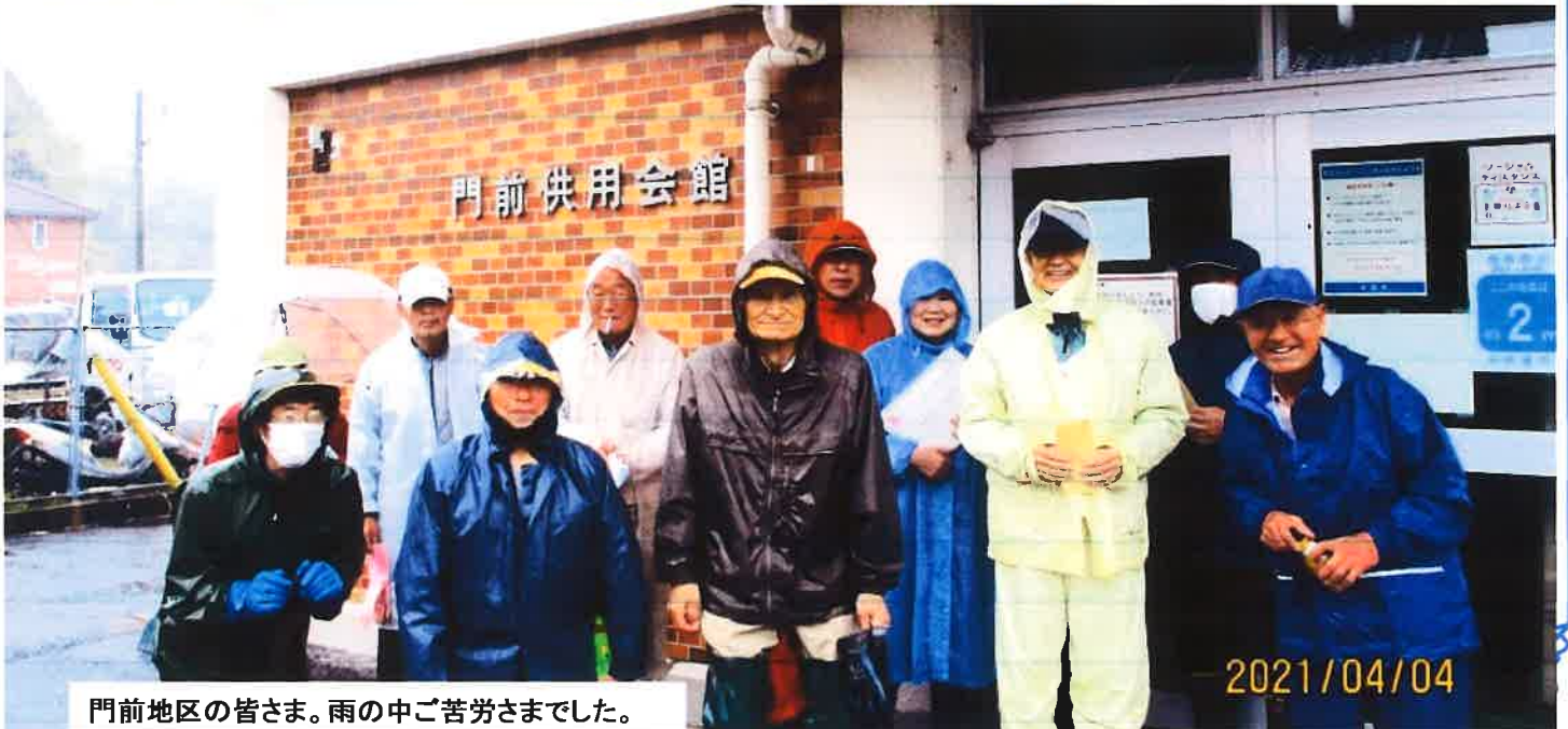
門前地区の皆さま。雨の中ご苦労さまでした。